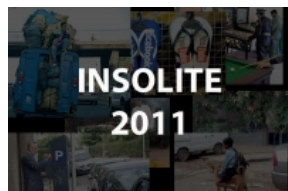
Les Photos Insolites du Maroc