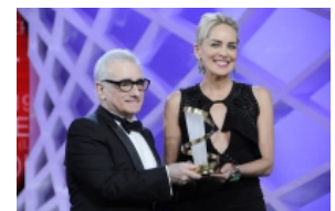
Festival international du film de Marrakech 2013 : Martin Scorsese et Sharon Stone