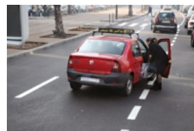
Le diktat des chauffeurs de taxis sur les routes...